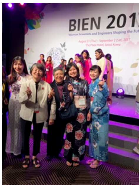
Traditional Custom Program において